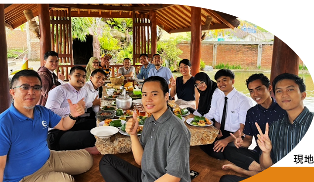
現地日本語学校の生徒たち