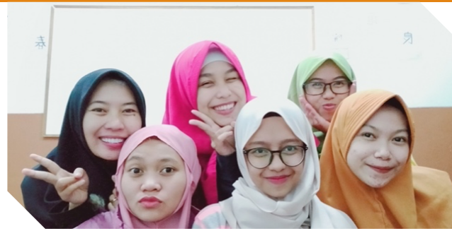
介護現場で働く人たち